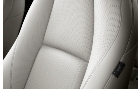
COMFORT-WHITE-PAKET Lederausstattung* in Pure White