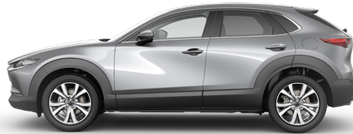
MACHINE GRAY (46G) 1)