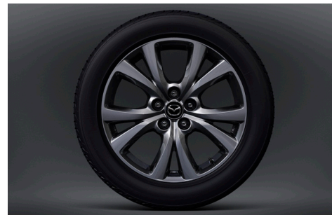
18-Zoll-Leichtmetallfelgen in Silbergrau mit Hochglanzfinish