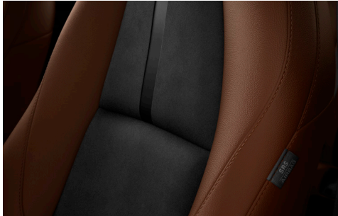
Sitzbezüge (Terrakotta Kunstleder/ Schwarz Leganu®)