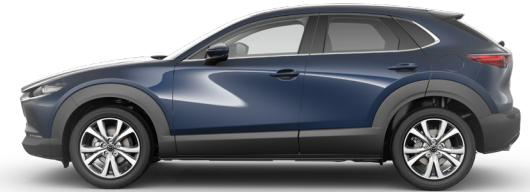
DEEP CRYSTAL BLUE (42M) 1)