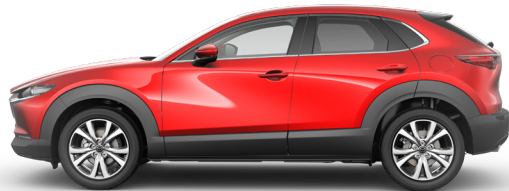
SOUL RED CRYSTAL (46V) 2)