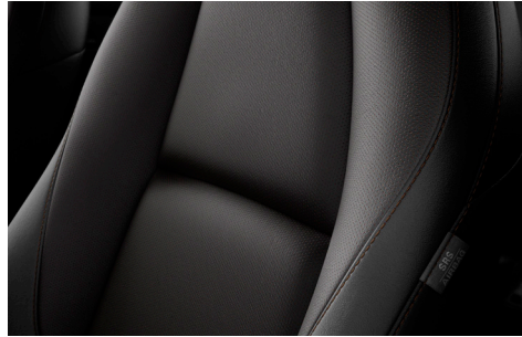
COMFORT-BLACK-PAKET Lederausstattung* in Schwarz