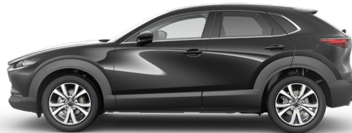
JET BLACK (41W) 2)