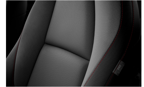
Stoffbezug in Schwarz mit roten Ziernähten