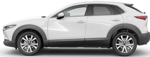
ARCTIC WHITE (A4D)