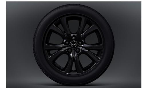
18-Zoll-Leichtmetallfelgen in Schwarz