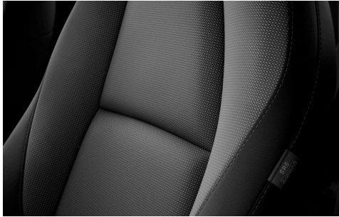
Stoffbezug in Dunkelgrau