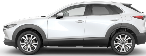
SNOWFLAKE WHITE (25D) 1)