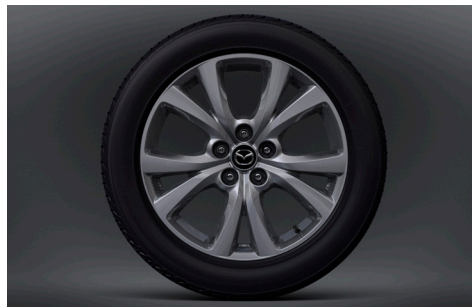
18-Zoll-Leichtmetallfelgen in Silber