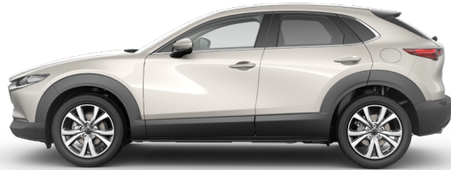
PLATINUM QUARTZ (47S) 1)