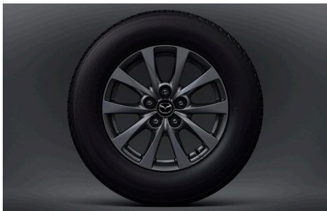
16-Zoll-Leichtmetallfelgen in Grau