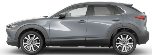
POLYMETAL GREY (47C) 2)