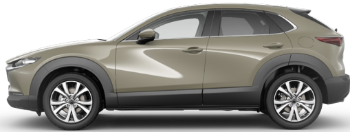
ZIRCON SAND (48T) 1)